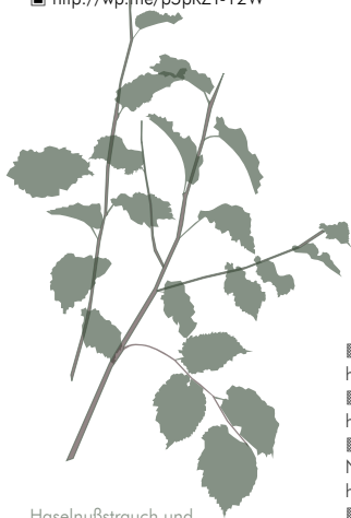
Haselnußstrauch und Bäume in der Grabsektion teilweise schattig

Mittlere Höhe der stehenden Urnensteine ca.80cm